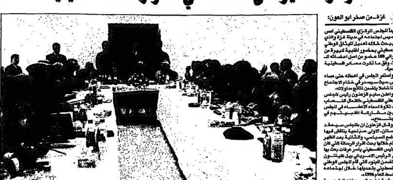
عزات يترأس اجلاس المجلس المركزي في غزة أمس